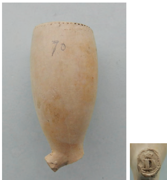
Afb. 2. Ovaal model, D gekroond (H 48 mm). (Collectie auteur,)