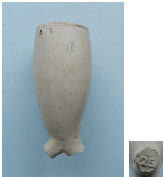
Afb. 3. Ovaal model, 25 gekroond (H 47 mm). (Collectie auteur, foto Bert van der Ling)